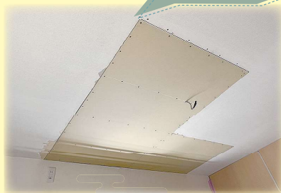
ボードを貼り替える