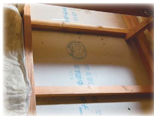
正常な建物の内部