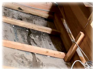
二次被害が深刻化した建物の内部

雨漏りの被害は、目に見える部分だけではなく、内部にも劣化や腐食が進んでいる場合があります。そのため、二次被害の深刻化を防ぐには、 「雨漏りを根本から修繕する」 ことが重要です！