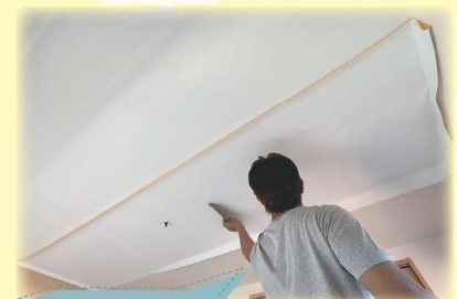
クロスを貼り替える