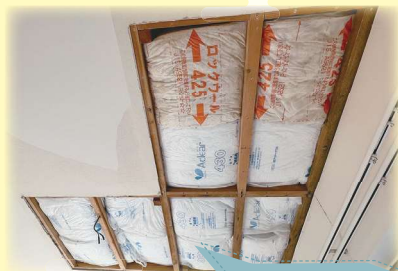
断熱材を入れ替える