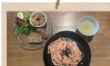
明太子クリームパスタ ¥1,300 (サラダ・スープ・ドリンク付)

パンとご飯を選べたので 私はパンにしました！ くるみパン最高でした♪ ランチのメニューは季節 によって変わるそうなので また行きたいです(^_^)