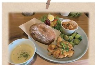
ランチプレート ¥1,300 (サラダ・スープ・ドリンク付)

今回は中戸次の旧道にある『HARIYO』というカフェに行ってきました！ 店内はオシャレな雰囲気、パンのいい香りが広がっていました(^_^)♪