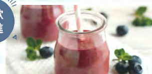
ベジフルドリンク