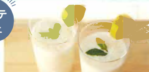
バナナヨーグルトドリンク