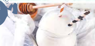
ハニービネガーミルク