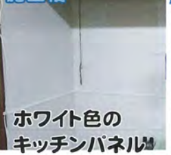
ホワイト色のキッチンパネル