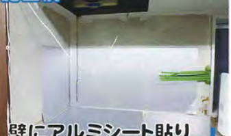
壁にアルミシート貼り