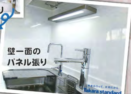
壁一面の パネル張り