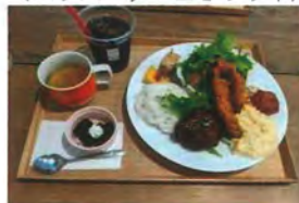
▼三日月ランチ1,518円(税込) (ハンバーグ+エビフライ)